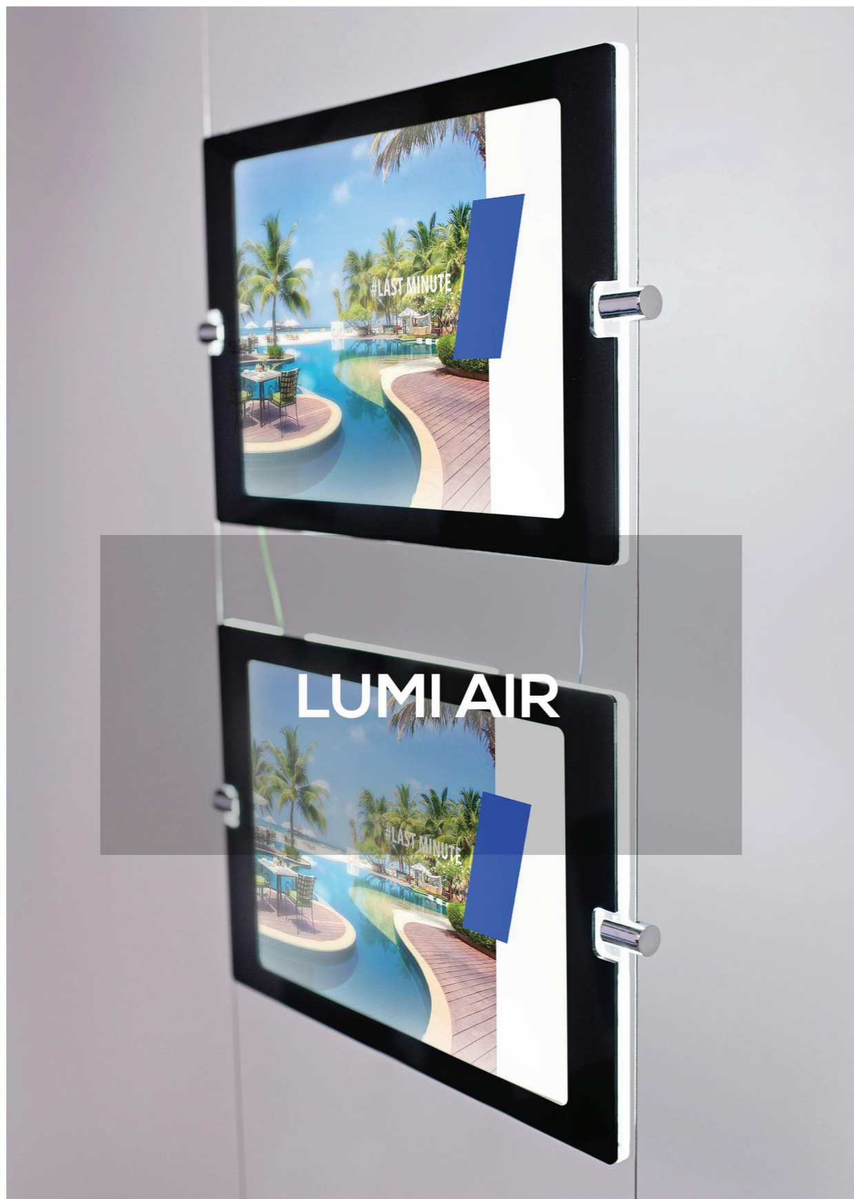
Ramy modułowe na linkach stalowych